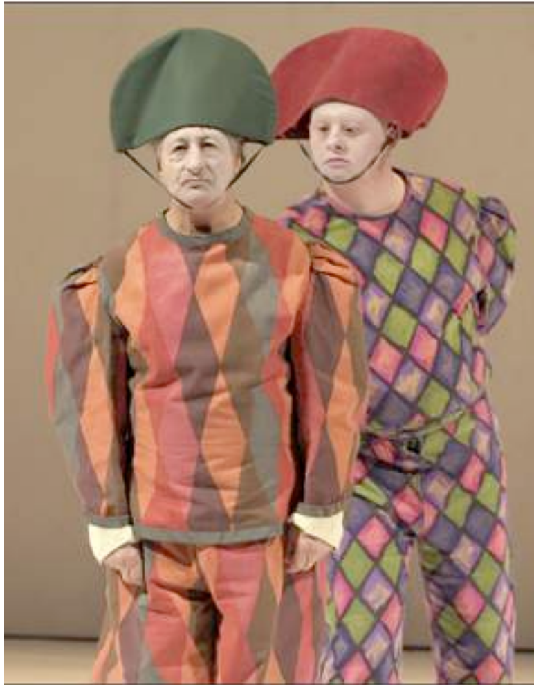
Figure 1.9 L'effet de présence : deux acteurs de la Compagnia Pippo Delbono dans Questo buio feroce , présenté au Festival Transamérique (Montréal) [En ligne] http://le-poisson-soluble.blogspot.com/2008/06/lhomme-sida.html (Page consultée le 10 juin 2009)