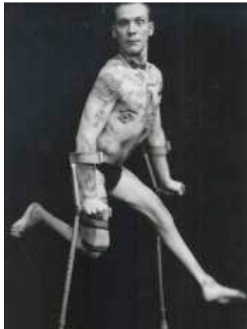
Figure 1.8 Acteur du Graeae (Londres), compagnie de théâtre incluant des personnes handicapées (physiques et sensorielles) et non handicapés. [En ligne] http://www.graeae.org/ (Page consultée le 22 janvier 2009)

Le Graeae, à Londres, (voir figure 1.9) est une compagnie de théâtre qui dirige des personnes handicapées (physiques et sensorielles) à développer des compétences d'acteur, d'auteur et de metteur en scène. La compagnie offre un programme d'entraînement pour acteur et des ateliers d'écriture. De plus, le Graeae soutient l'inclusion des personnes handicapées à des performances professionnelles.