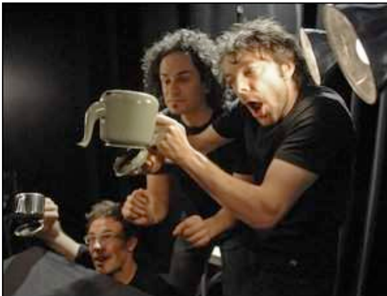
Figure 1.3 Théâtre de La Pire Espèce. (Tirée de Théâtre de La Pire Espèce. 2003. Site du Théâtre de la Pire Espèce . [En ligne] http://www.pire-espece.com/ubusourd.htm (Page consultée le 22 janvier 2009)

Le Théâtre de la pire espèce, compagnie de théâtre professionnelle Montréalaise, a intégré un troisième acteur-marionnettiste sourd à la distribution de Ubu sourd la table 30 (voir figure 1.3). Celui-ci fait la traduction simultanée du texte et intervient dans la trame du spectacle, en manipulant des objets ou en trahissant (comme tout bon traducteur) les intentions des auteurs selon son plaisir.