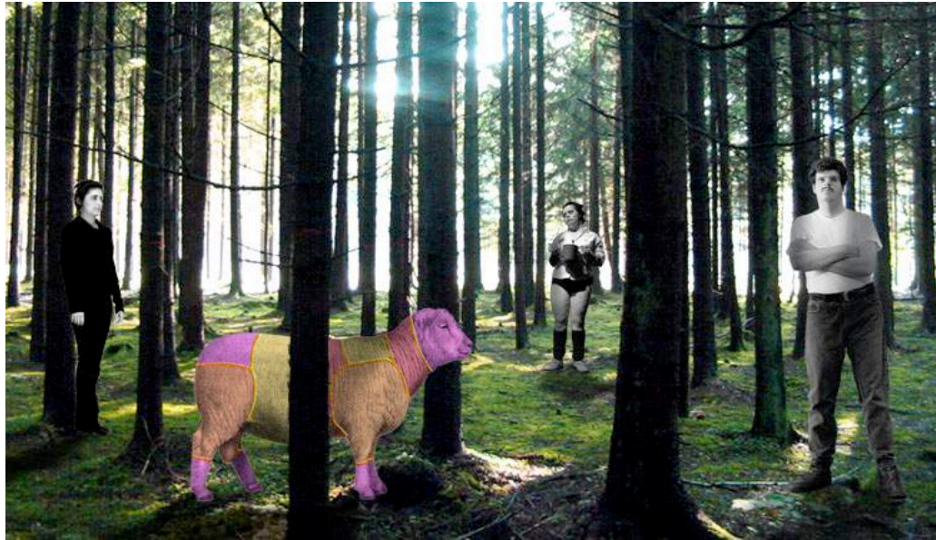
Figure 1.4 Affiche de la compagnie Joe Jack and John. (Tirée de Joe, Jack and John. 2009. Site de la compagnie de théâtre Joe, Jack and John [En ligne] http://www.joejacketjohn.com/ (Page consultée le 22 janvier 2009).